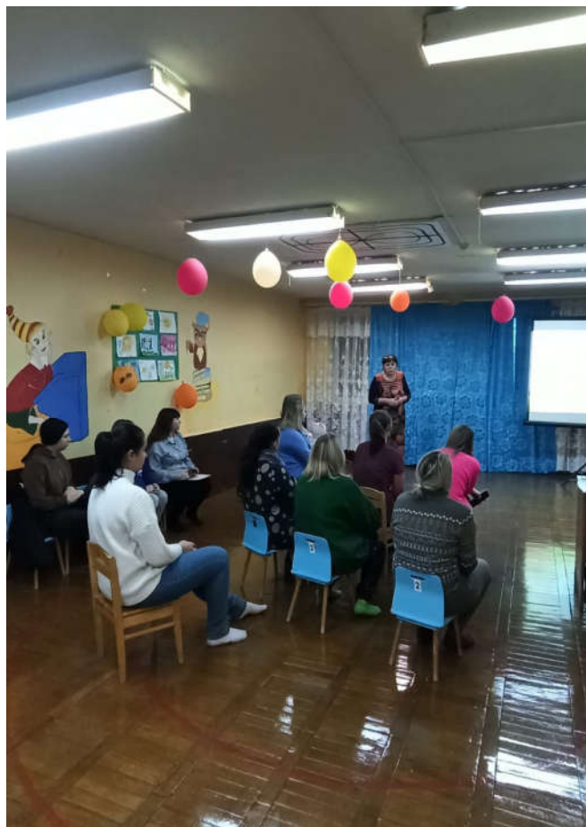
Родительское собрание «Здоровая семья-здоровый ребенок»