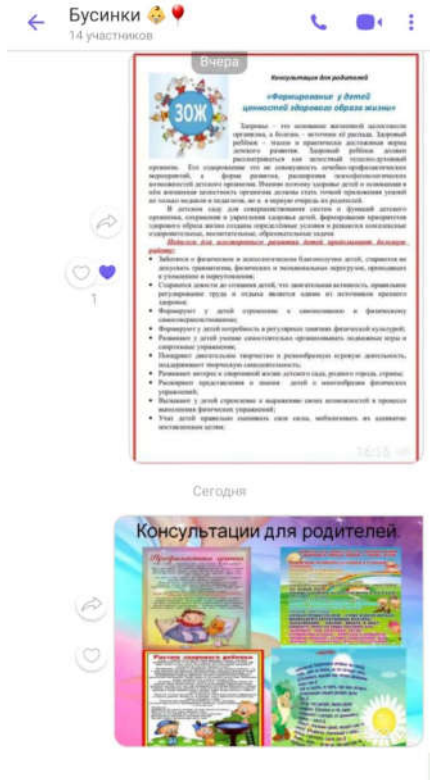
Рассылка консультаций родителям.