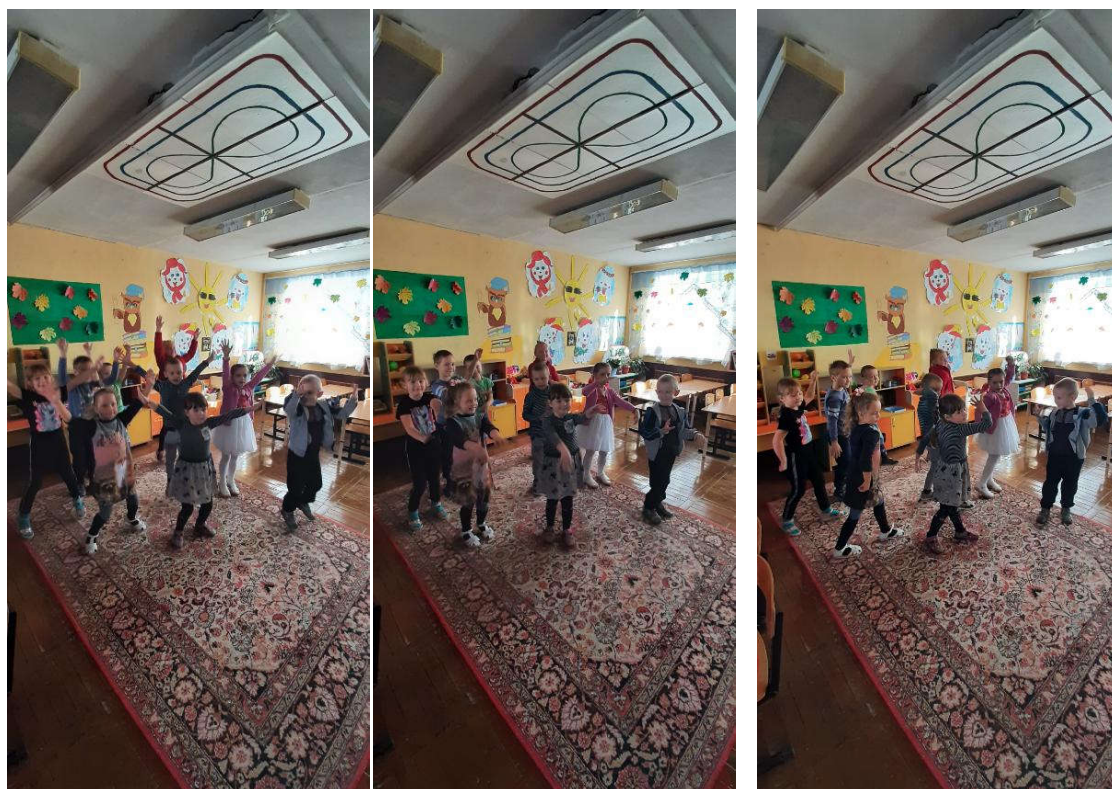
Флеш – моб.

Хочется отметить, что проведенный День здоровья способствовал не только физическому развитию воспитанников, но и их нравственному воспитанию, формированию положительных эмоций.