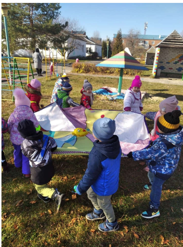
Спортивная игра на прогулке.