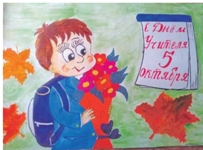
С ДНЁМ УЧИТЕЛЯ! Рисунок Валерии Шиловой (Пятницкая школа Волоконовского района)