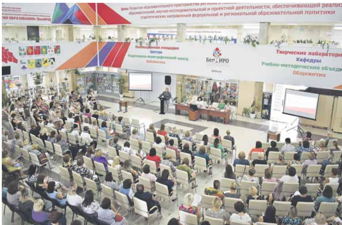
Современный, методически и технологически оснащённый центр непрерывного образования