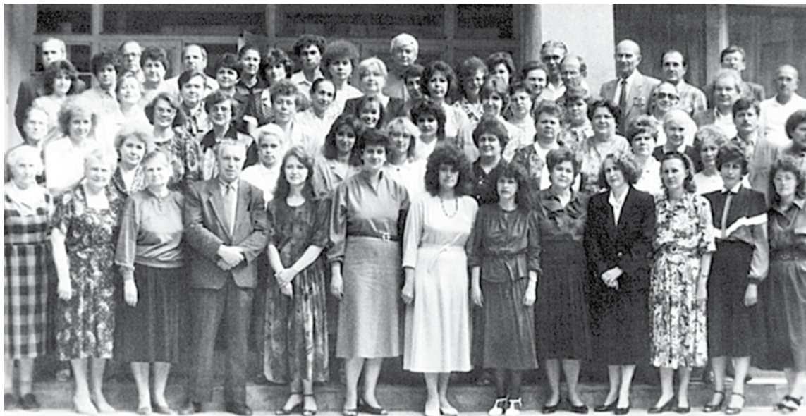
Коллектив Белгородского областного института усовершенствования учителей, 1994 год

Благодаря профессионализму, преданности своему делу, большому трудолюбию, таланту преподавателей, педагогов институт развивался, успешно выполняя свою главную миссию — повышать качество образования Белгородской области. Сегодня наш институт обладает высоким потенциалом, компетентным и работоспособным профессорско-преподавательским составом, который полон творческих планов и замыслов. Надеюсь, что всё это позволит нам эффективно реализовывать как региональные, так и федеральные инициативы. Желаю всем преподавателям и сотрудникам Белгородского института развития образования радости, профессиональных побед, счастья и любви близких, душевного равновесия, интересного и плодотворного учебного года!