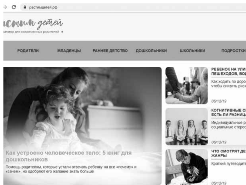
СКРИНШОТ С САЙТА РАСТИМДЕТЕЙ.РФ

Уже сейчас портал включает более 200 полезных экспертных материалов на темы, интересующие родителей. Кроме того, чтобы быть в курсе новостей в сфере детского развития и воспитания, родители могут подписаться на еженедельную рассылку на сайте растимдетей.рф .