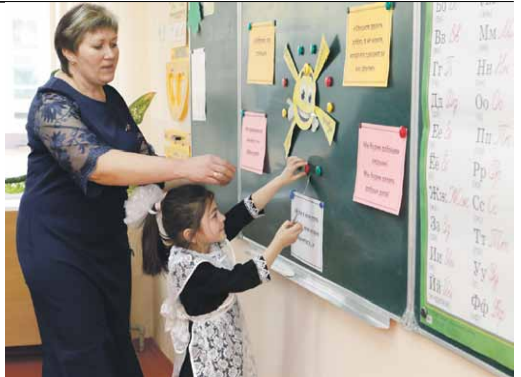
Урок в начальной школе села Степное