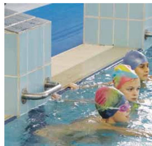
Ученики школы № 2 занимаются в бассейне ФОКа