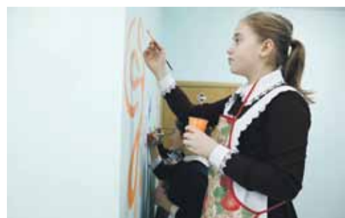
Ученики Степнянской школы сами разукрашивают стены