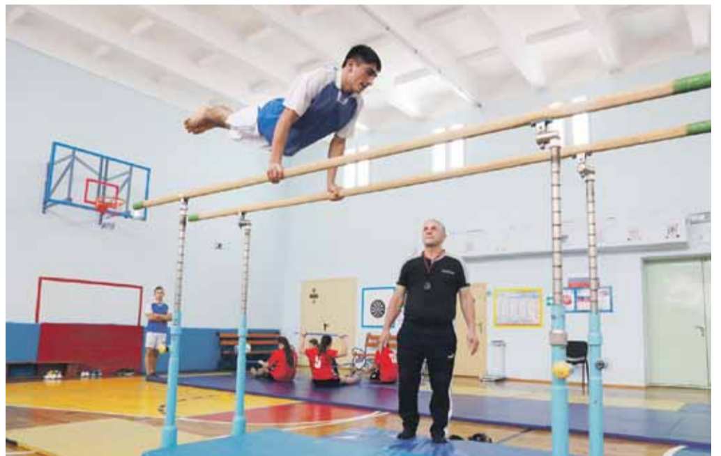
На внеурочных занятиях по спортивной подготовке в Степнянской школе