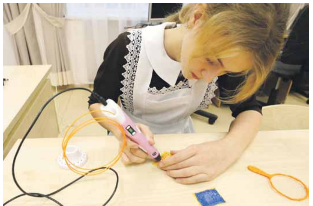
В Вязовской школе дети быстро освоили 3D-ручки