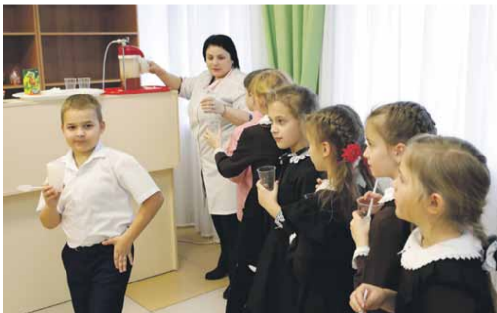
Каждый ученик школы № 2 за год проходит курс кислородных коктейлей

Школу села Степное часто называют многонациональной. Так сложилось, что в 90-е годы сюда переехали жить несколько десятков семей турок-месхетинцев. Люди здесь прижились, построили дома, родили детей, нашли работу... Но есть одно маленькое но: в большинстве семей до сих пор говорят на родном языке и в селе много детей, вынужденных знать два языка. Но в школе-то обучение ведётся на русском. И все экзамены нужно сдавать на русском языке.