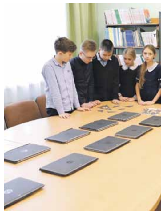
В библиотеке школы № 2