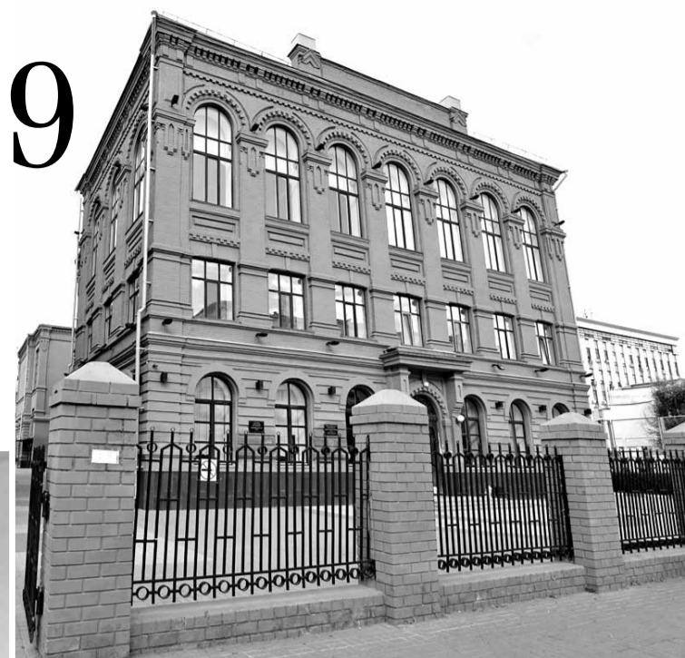
Лицей № 9

— Использование картирования позволило выявить проблемные места в образовательной деятельности и проанализировать возможности их устранения. Сейчас в лицее разработан 21 бережливый проект, шесть из которых уже реализованы.