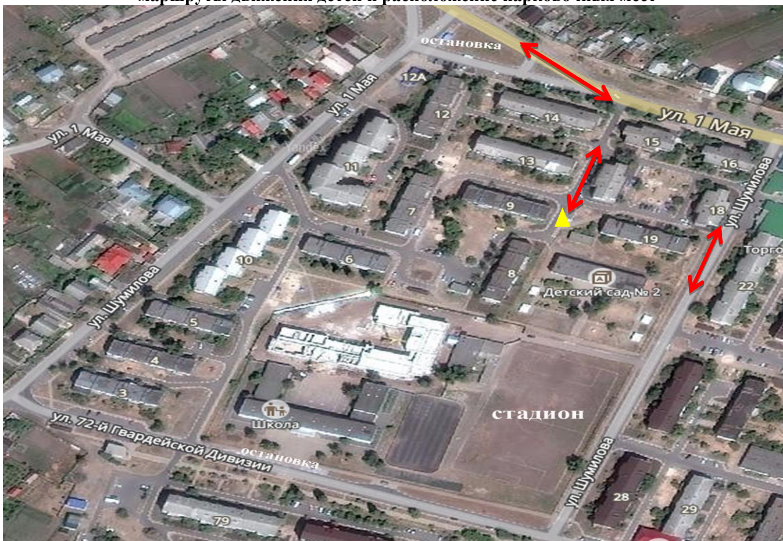
План-схема № 2. Организации дорожного движения в непосредственной близости от МБДОУ с размещением соответствующих технических средств организации дорожного движения, маршруты движения детей и расположение парковочных мест

Пути движения транспортных средств и детей (обучающихся)